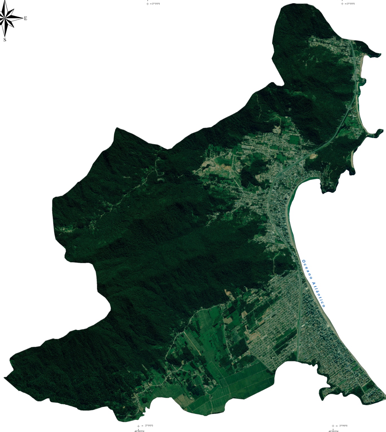
Imagem de Satélite (2008)